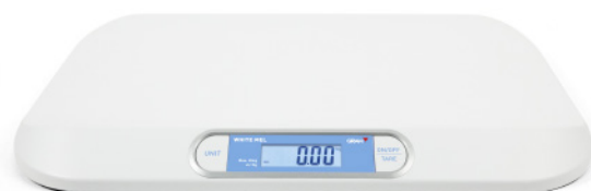
Plateau de pesée à grande surface Plateau de pesée à grande surface et à profil bas.